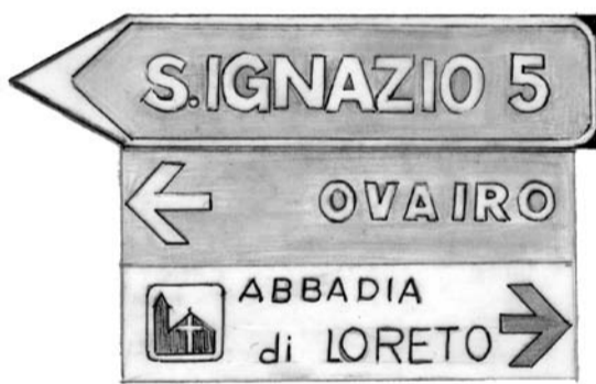
Associazione ABBADIA DI LORETO Lanzo Torinese

Poi venne il tempo del diporto, trainato dal mito, forse miope, del benessere illimitato. Si sale la montagna con cavalli da equitazione, in mountain-bike, con rombanti auto da rallye o a piedi per un sano trekking. Sport e turismo, efficienza, comodità ed agonismo. Si passa accanto al bosco, ogni giorno più intricato, buono solo ormai per funghi o per rare e difficili passeggiate. Si trascurano, con la terra, le nostre stesse radici.