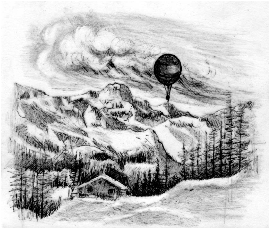
Bessanese e quadro ex voto

Gli altri superstiti, salvati da una provvidenziale valanga che li preservò dai crepacci e dopo aver trascorso una seconda notte in quota, riuscirono infine a raggiungere il Pian della Mussa dove trovarono aiuto.