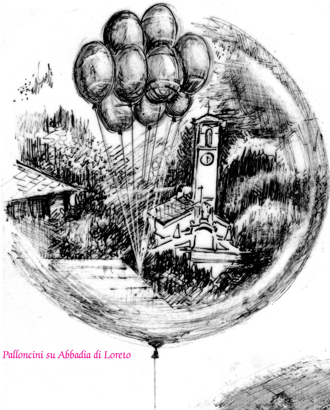
Palloncini su Abbadia di Loreto

Il più antico e semplice tipo di pallone volante ad aria calda è la lanterna cinese. Un involucro di carta, di modeste dimensioni, riscaldato all'interno da una fiammella.