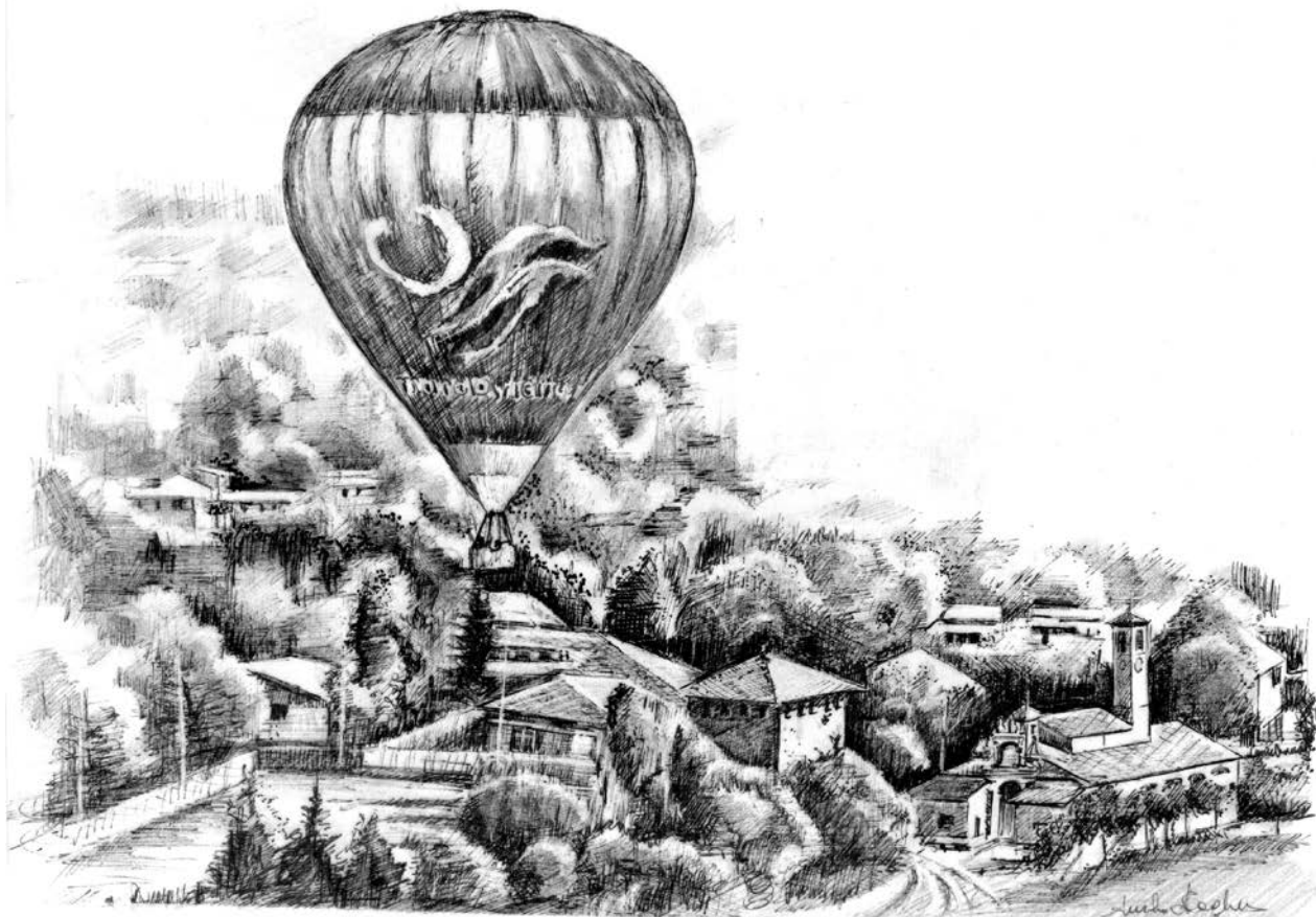
Mongolfiera su Loreto

La sera dell'11 settembre 2012 prende forma sul "campo" dell'Abbadia di Loreto una mongolfiera. E' una simpatica sorpresa dovuta all'iniziativa dei priori dell'anno e alla scuola di volo North West Service. Il suo levarsi nel cielo è anche un omaggio alla Madonna di Loreto, patrona degli aviatori, nel ricordo della tradizione leggendaria secondo cui la S. Casa sarebbe stata trasportata in volo dagli angeli nel luogo in cui sorge il celebre Santuario di Loreto nelle Marche.