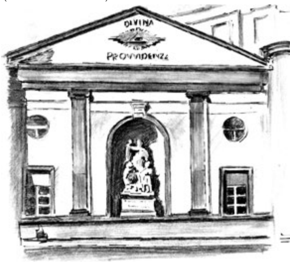
Associazione ABBADIA DI LORETO Lanzo Torinese